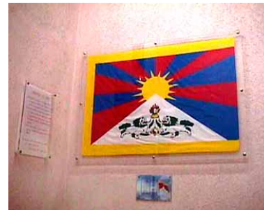
Mairie d'Auriol (13) Exemples de plaques drapeau et explicative placée à l'intérieur de la mairie