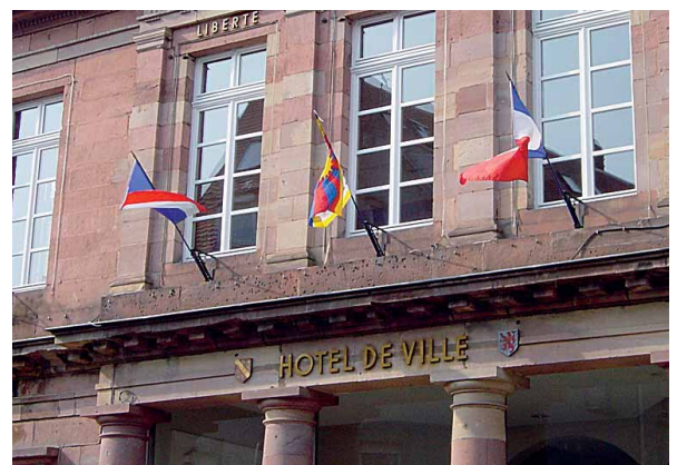
Mairie de Sélestat (67)