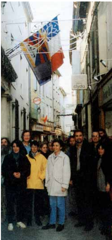
Mairie d'Isles-sur-Sorgues (84)