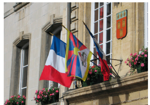
Mairie de Bagnols-sur-Cèze (30)