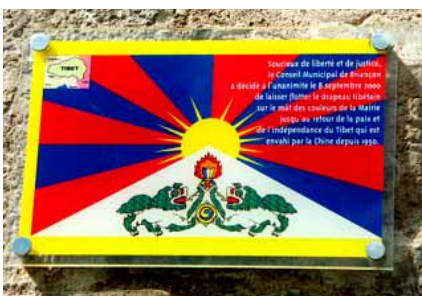
Mairie de Briançon (05) Exemple de plaque drapeau et drapeau placée sur le mur de la mairie