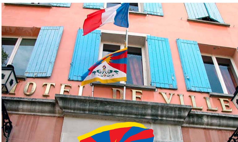
Mairie de Malaucène (84)