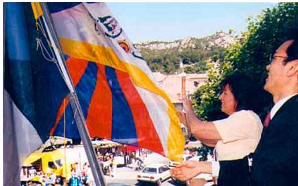
Mairie de Vitrolles (13)