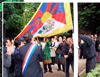
Mairie de Drancy (93). Le drapeau a été placé de façon permanente dans le jardin public Jacques Duclos